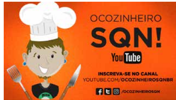
Canal do YouTube e Mídias Sociais